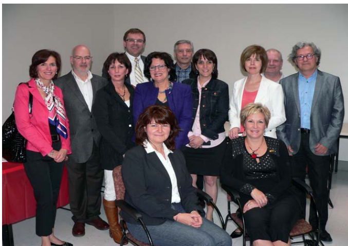
Membres qui ont célébré 25 ans de service en 2011